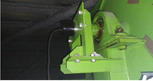
画像5 エンコーダー交換前