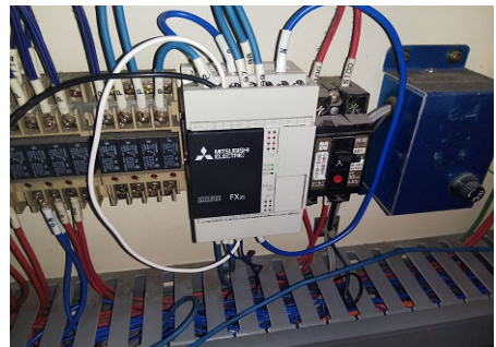
画像4 エンコーダー用シーケンサー交換後