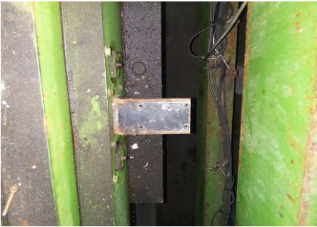
画像9 リミットスイッチ取り外し