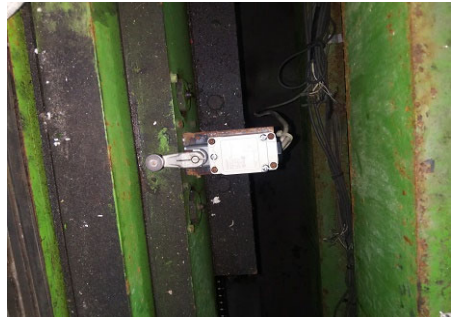
画像10 リミットスイッチ交換後