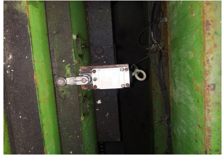
画像8 リミットスイッチ交換前