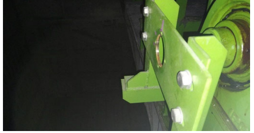
画像6 エンコーダー取り外し