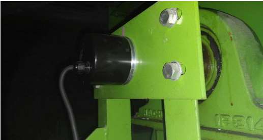
画像7 エンコーダー交換後