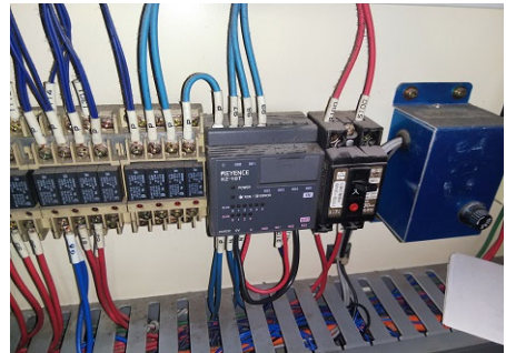
画像2 エンコーダー用シーケンサー交換前